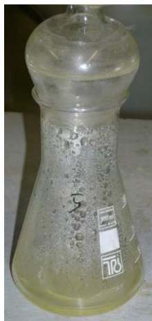
Abb. 3. 100 ml Erlenmeyerkolben mit Sedimentaufschluss in HCl auf einer Kochplatte und mit wassergefüllter "Kühlbirne" als Kondenswasserfalle.