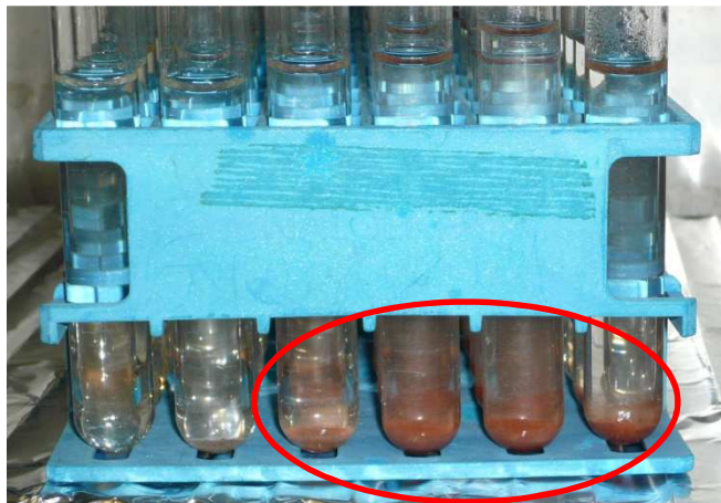
Abb. 2. Eisenhaltige Aschen im sauren Persulfataufschluss (Goethit)