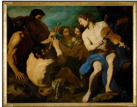
Novelli, Pietro: Musikalischer Wettstreit zwischen Apollo und Marsyas. Um 1631/1632.

Kaum hat jemand so vom Untergang der Bauern aus dem Lykiervolk berichtet, entsinnt sich ein anderer jenes Satyrs, den Latonas Sohn Apollo büßen ließ, als er ihm mit seinem Spiel auf der Flöte der Pallas unterlegen war: »Warum reißt du mich von mir selbst los?« rief er. »Ach, es reut mich! Ach, so viel« - er schrie es wieder und wieder - »ist eine Flöte nicht wert!« Während er so schrie, wurde ihm die Haut überall an