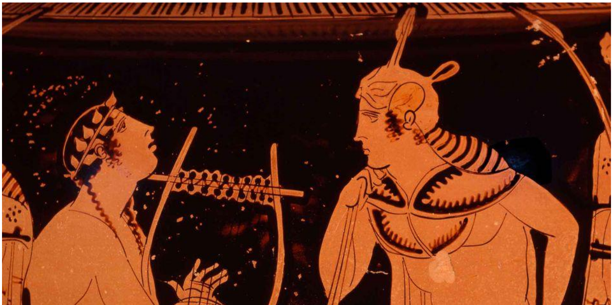
Orpheus, der mythische Sänger aus Thrakien, galt nach dem Gott Apollon in der Antike als der Musiker par excellence. Attischer Krater, Detail, um 440 v. Chr.

Sonderausstellung „Klangbilder – Musik im alten Griechenland“ im Alten Museum Berlin