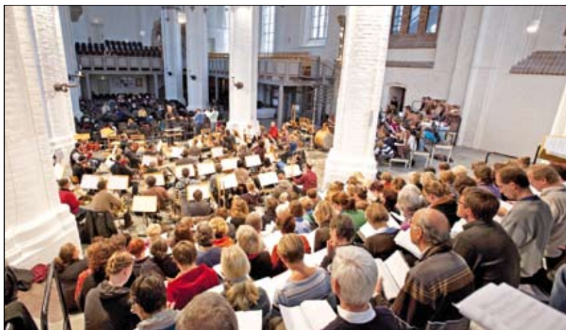
Gesungener Glaube: Gleichermaßen nahmen Text und Musik die Hörer mit in den Prozess des Bezeugens und Bekennens.

Das zweite Segment des Projekts am 6. November vereinte zwei theologische Vorträge und das Chorwerk „Credo. Fünf Stimmen nach Johannes“ von Karl Scharnweber.