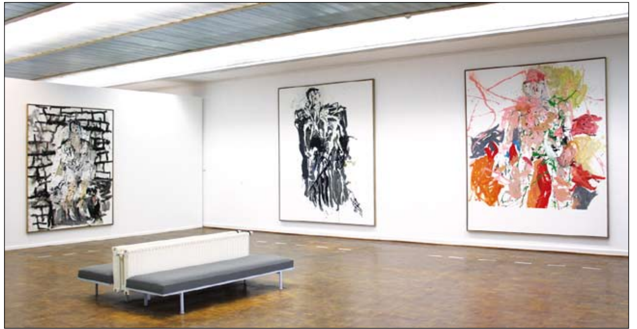
Die Ausstellung zum CREDO-Projekt ist noch bis zum 29. Januar, dienstags bis sonntags 11 bis 18 Uhr, in der Rostocker Kunsthalle in der Hamburger Straße 40 zu sehen.

Eckart Reinmuth griff in seinem Vortrag „Vertrauen, nicht glauben“ die Abrahamgeschichte erneut auf, um an ihr die Dimension des Vertrauens darzulegen. Glauben fängt mit der Erfahrung des Vertrauens an. Abrahams Erfahrung ist: Gott sieht, obgleich er sich selber nicht sehen lässt; Gott ist nahe, obgleich er nicht zu fassen ist. Vertrauen, das nicht blind bleibt, sondern verantwortlich gelebt wird. Mit der Erfahrung des Vertrauens fange Glauben an, aus dem das eigene Credo entstehe und aus dem sich die Bildwelt unseres Glaubensbekenntnisses neu erschließen könne. Es gehe ja nicht um ein Glauben,