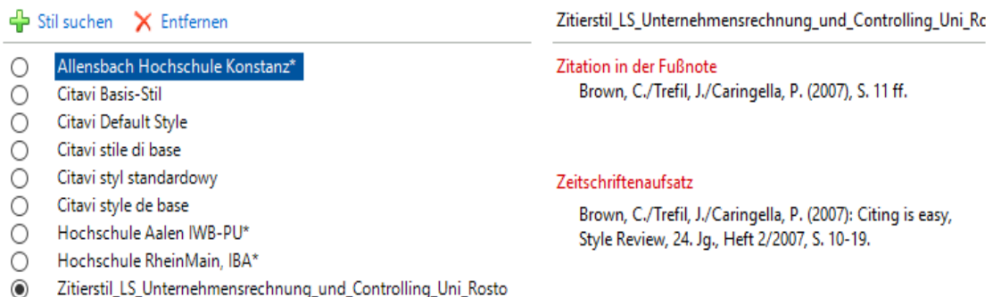
Abbildung 3: Zitierstil in Citavi festlegen