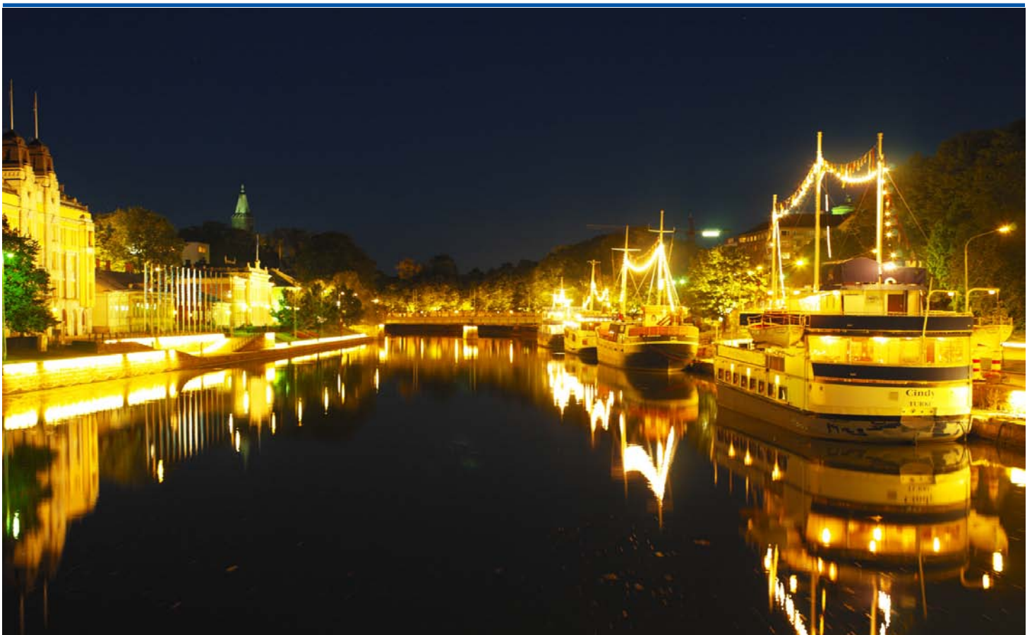
Turku Baltic Sea Days 2014.

Die Turku Baltic Sea Days 2014 boten darüber hinaus auch ein buntes (kulturelles) Rahmenprogramm für die örtliche Bevölkerung. In ihrer Vielfaltigkeit und Kompaktheit waren die Turku Baltic Sea Days 2014 eine gelungene Veranstaltung und Spiegel der Ostseezusammenarbeit und regen zur Nachahmung an – dann eventuell mit einer etwas lösungsorientierteren Ausrichtung (z.B. als Baltic Sea Solutions Days). (ps)