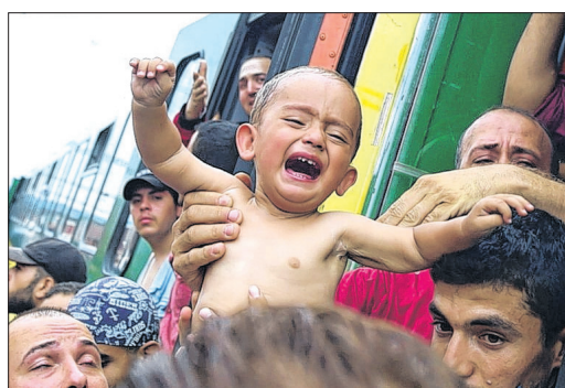
Verzweiflung im ungarischen Bicske: Flüchtlinge müssen den Zug verlassen.

Budapest – Die ungarische Polizei hat die in Richtung österreichische Grenze fahrenden Züge mit Flüchtlingen angehalten und die Reisenden zum Aussteigen aufgefordert. Einer der aus Budapest kommenden Züge stoppte in Bicske, rund 37 Kilometer westlich der Hauptstadt, der andere bei Győr im Westen Ungarns. Ziel war es, die Menschen in Flüchtlingslager zu bringen. Zuvor hatte Regierungschef Viktor Orban den Zustrom von Flüchtlingen als „deutsches Problem“ bezeichnet. Seiten 2 und 4