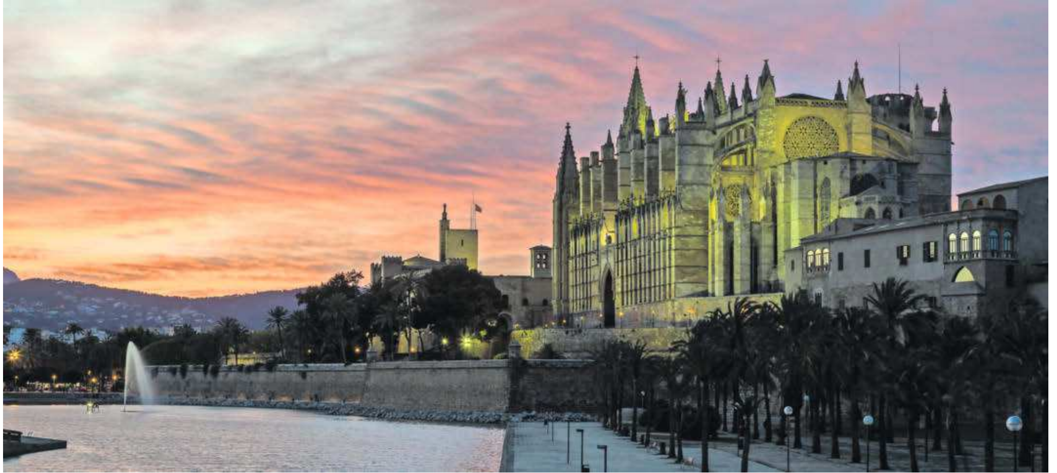
„Im Winter haben wir hier die schönsten Sonnenuntergänge des Jahres“: Kathedrale von Palma de Mallorca.

Viele Spanier würden generell gern in der westeuropäischen Zeitzone leben, wie die Portugiesen und die Briten. Viele Kritiker verweisen darauf, dass dies früher auch so üblich gewesen sei – bis Diktator Francisco Franco aus Sympathie für das Hitler-Regime die mitteleuropäische Zeit eingeführt habe.