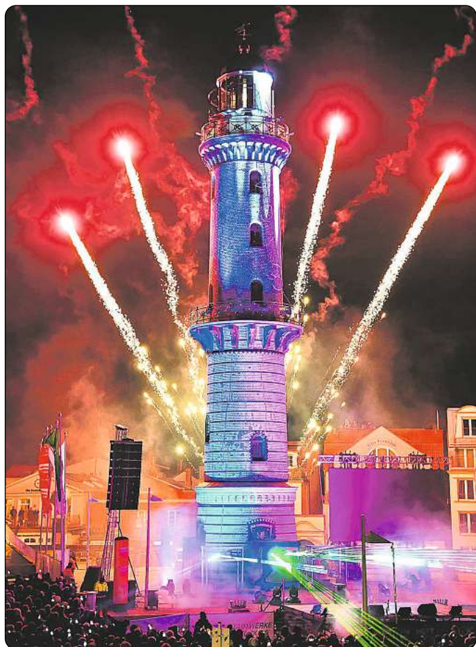
Zehntausende Schaulustige verfolgten das „Turmleuchten“ an der Promenade in Warnemünde.

(Weitere Informationen zu Veranstaltungen im Internet unter www.rostock800600.de )