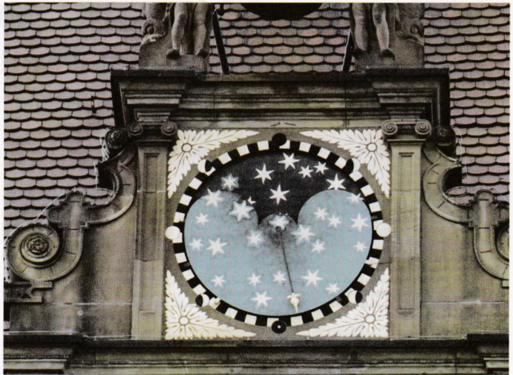
Bild 2: Die Monduhr kurz vor Neumond: Von der Mondscheibe im Ausschnitt ist schon nichts mehr zu sehen. Der Zeiger gibt an, dass am nächsten Tag Neumond sein wird.

Die obere Bekrönung der Uhr bildet ein steinernes Tor mit drei