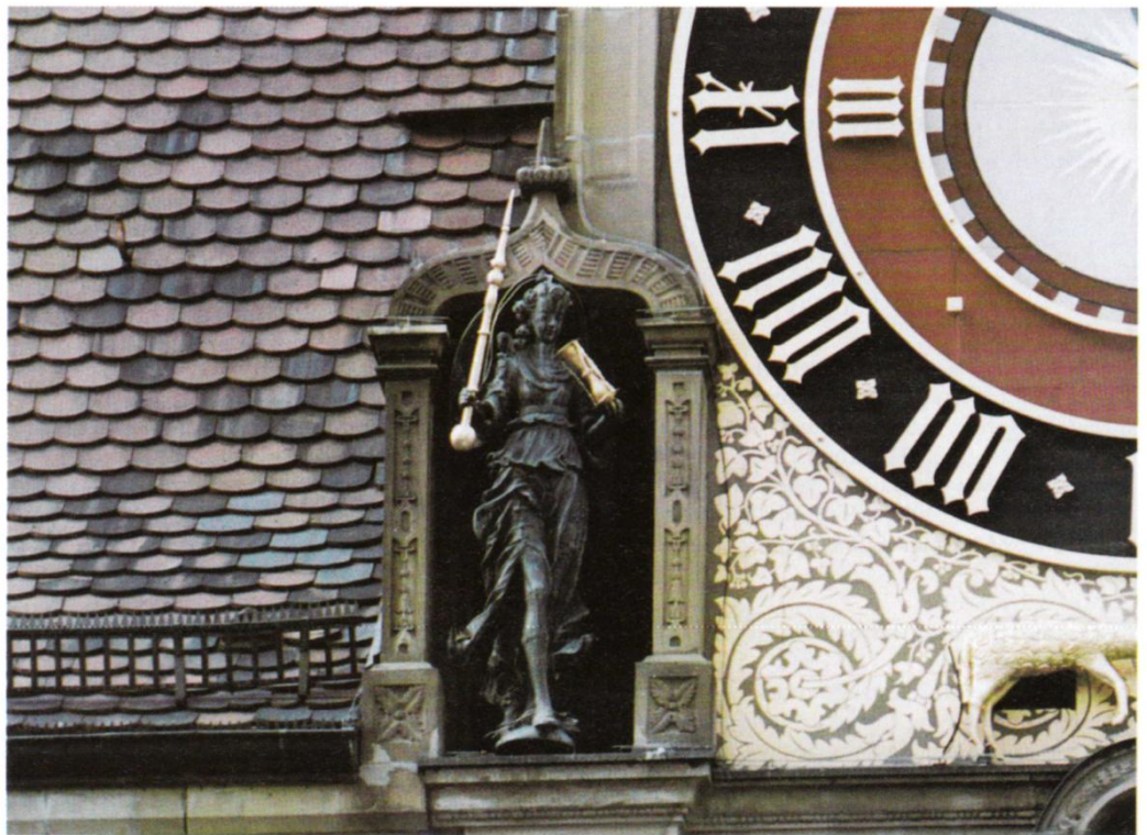
Bild 3: Das „Gottfriedle“, eine der Automatenfiguren, dreht zur vollen Stunde die Sanduhr und bewegt das Zepter im Takt der Stundenschläge.