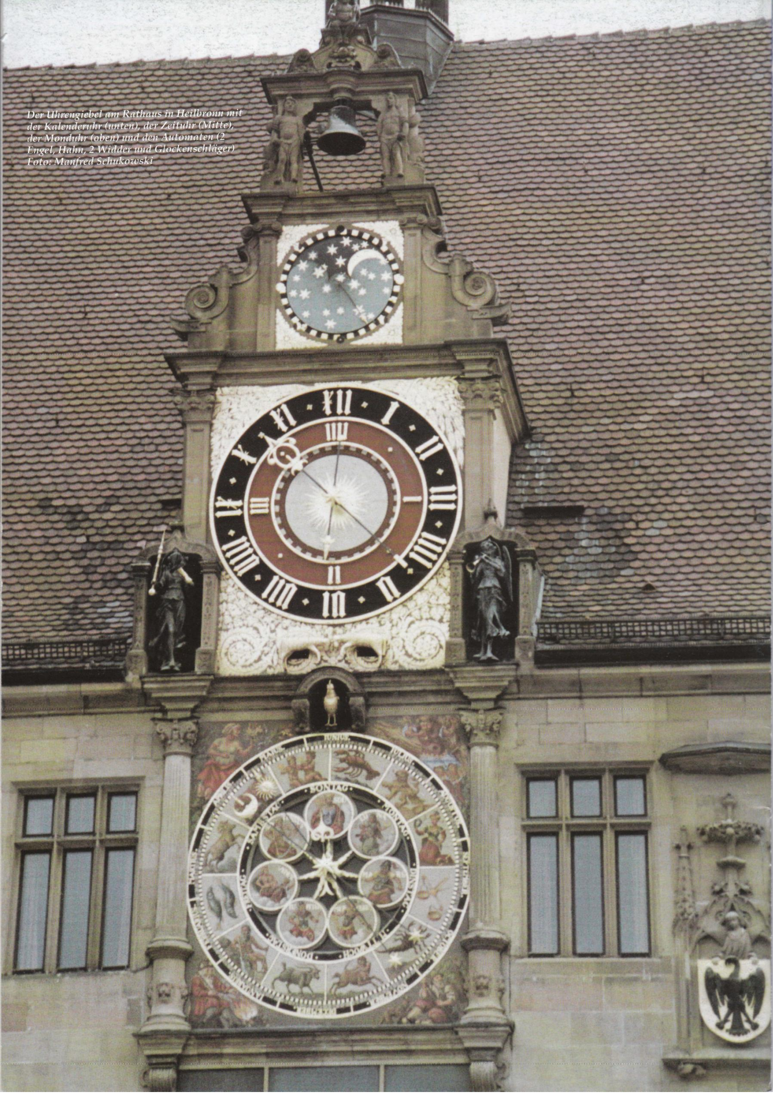
Der Uhrengiebel am Rathaus in Heilbronn mit der Kalenderuhr (unten), der Zeituhr (Mitte), der Monduhr (oben) und den Automaten (2 Engel, Hahn, 2 Widder und Glockenschläger)