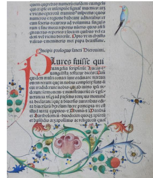
Handkolorierte Buchmalerei auf einem Druck aus den Beständen der Universitätsbibliothek

Es folgen zwei Führungen in Form einer Blockveranstaltung zu Beginn der vorlesungsfreien Zeit.