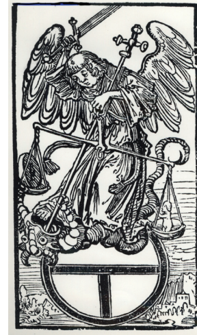
Druckermarke aus dem Jahr 1521

Die ersten, Fraterherren genannten Brüder trafen 1462 aus Münster kommend in Rostock ein. 1464 pachtete die Gemeinschaft einige Gebäude in unmittelbarer Nähe des heutigen Michaelisklosters. 1472 erbauten sie auf diesem Gelände eine Kapelle, die dem Erzengel Michael geweiht wurde. Seitdem nannten die Rostocker sie häufig nur noch Michaelisbrüder.