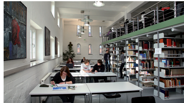
Fachbibliothek Theologie und Philosophie

Im November 1999 war der Wiederaufbau des Michaelisklosters abgeschlossen. Seitdem beherbergt das ehemalige Fraterhaus der Brüder vom Gemeinsamen Leben neben der Fachbibliothek Theologie und Philosophie auch die Sondersammlungen der Universitätsbibliothek.